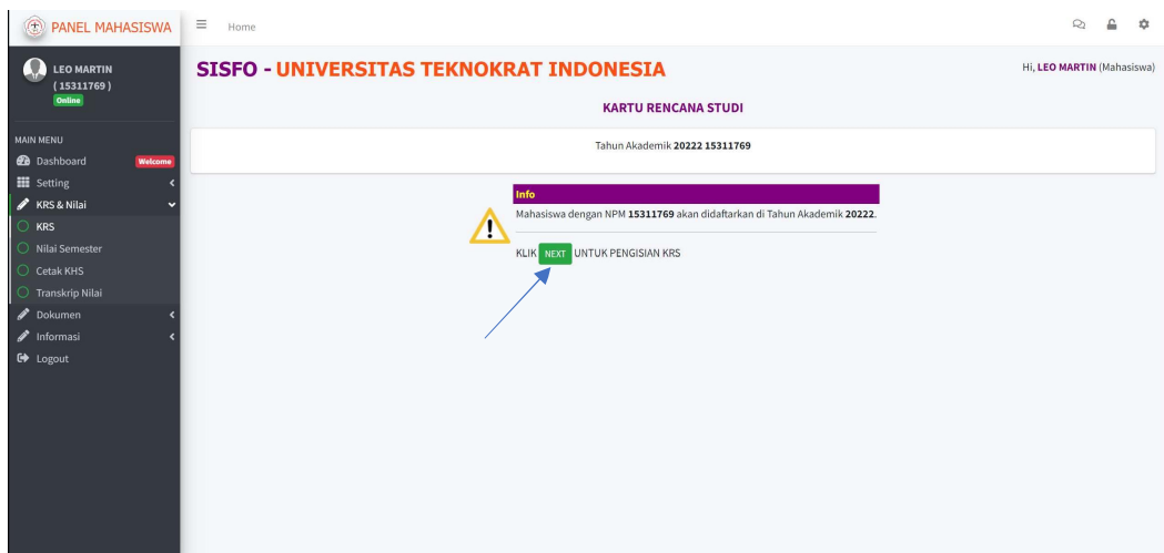
Gambar 2. Halaman KRS